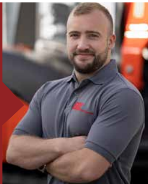
MARCEL CONEN Ersatzteilservice

0 24 21 - 20 60 13 15 p.pohl@bz-baumaschinen.de